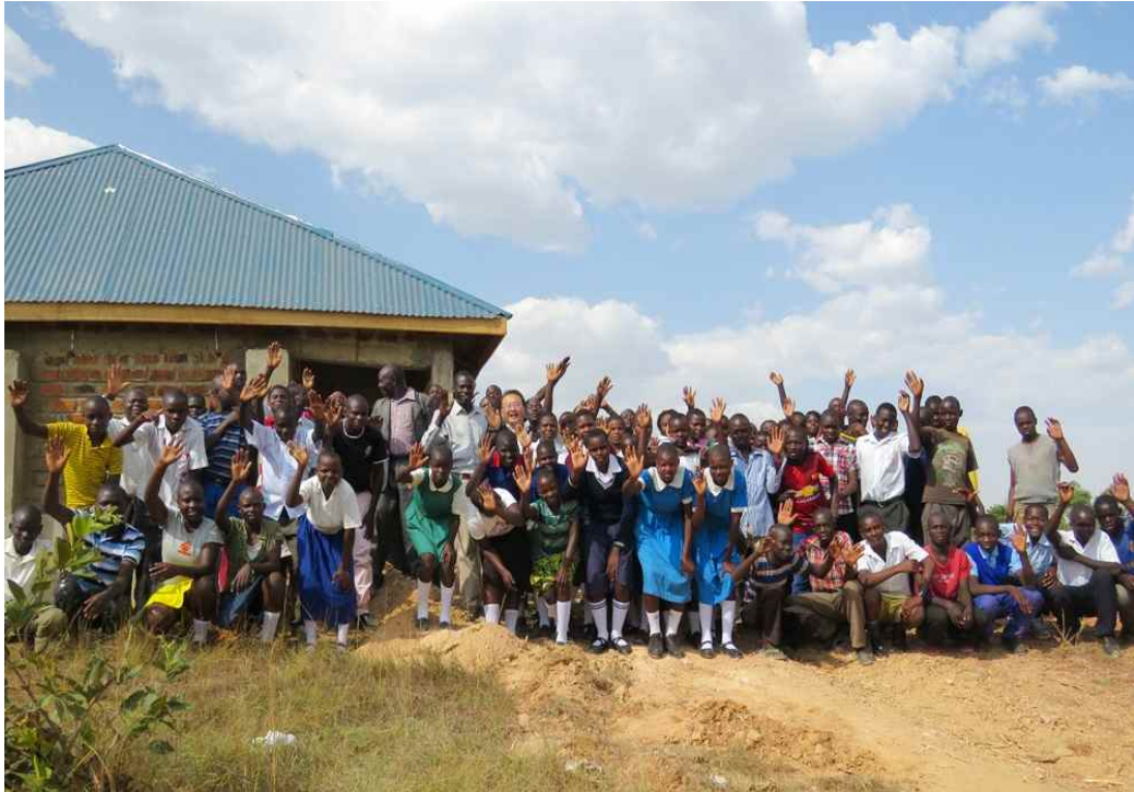
케냐 LWM 주율 중,고등학교 학생들이 인사드립니다!(2015.1)