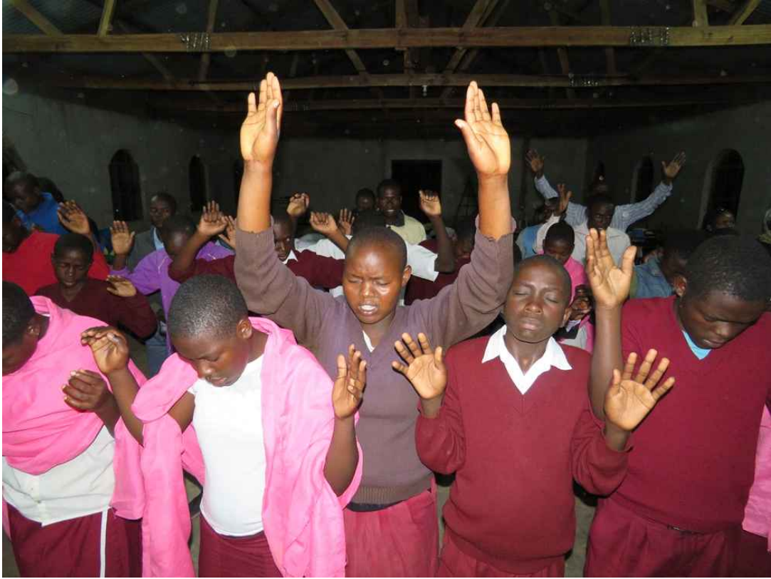
새벽 5시 경건시간 간절히 기도하는 학생들