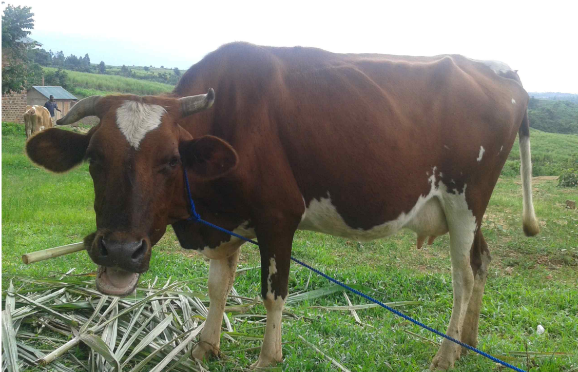
케냐 주을 중고등학교 어미 젖소 구입 (2015.5.)