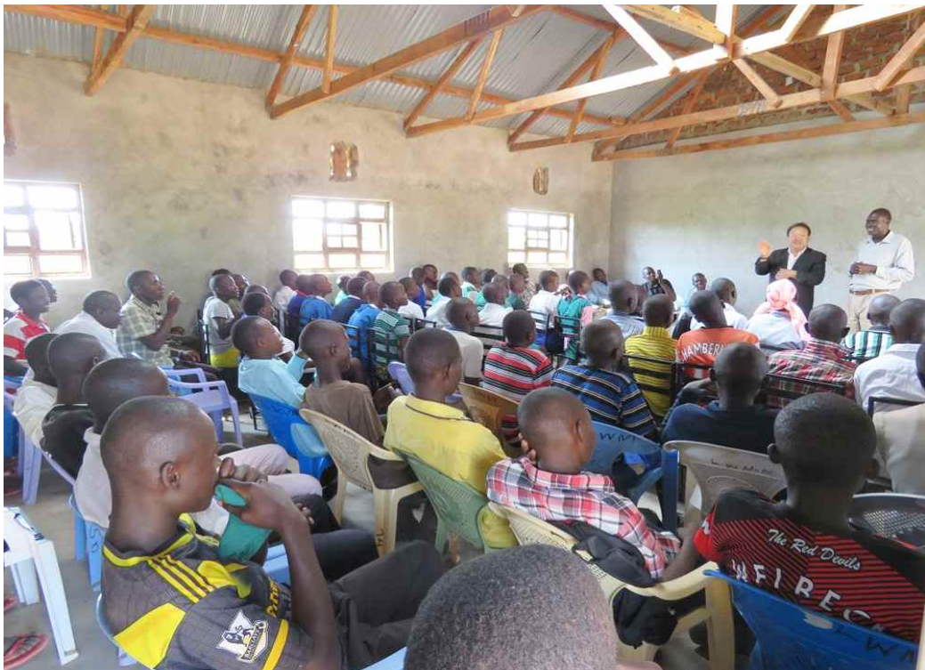
학교 개강 전 2박3일 수련회를 가진 학생들