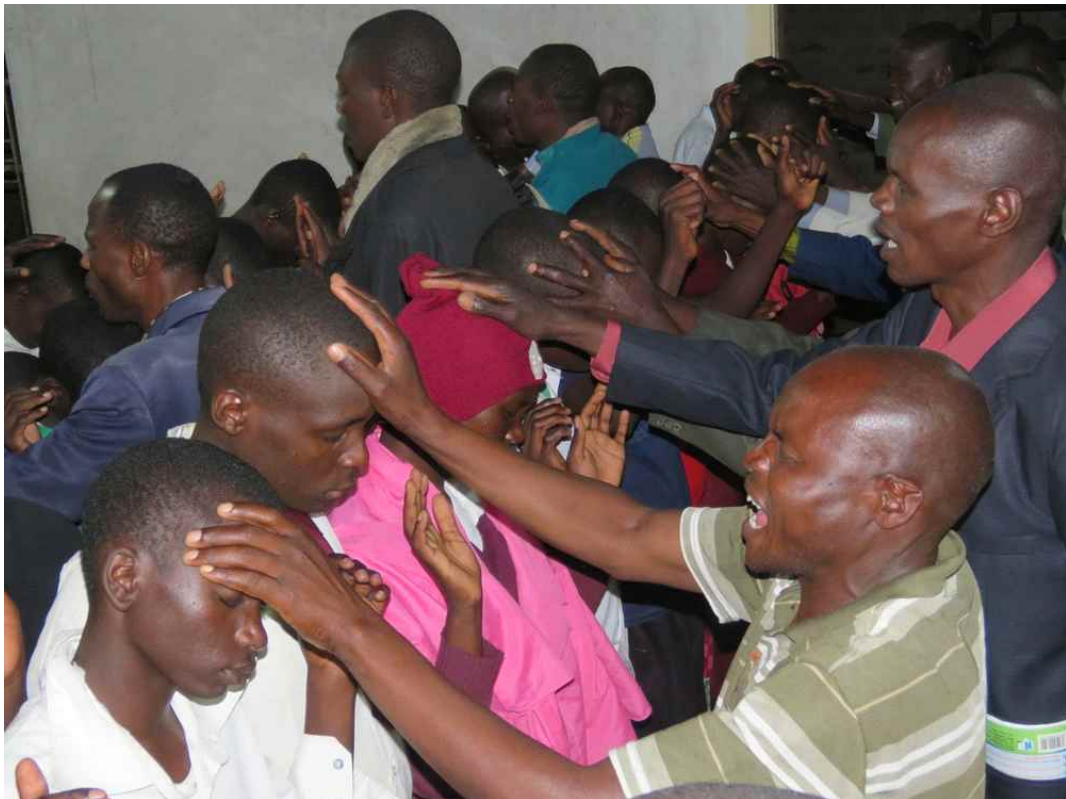
학생들을 위해 중보기도하는 자국민 선교사들