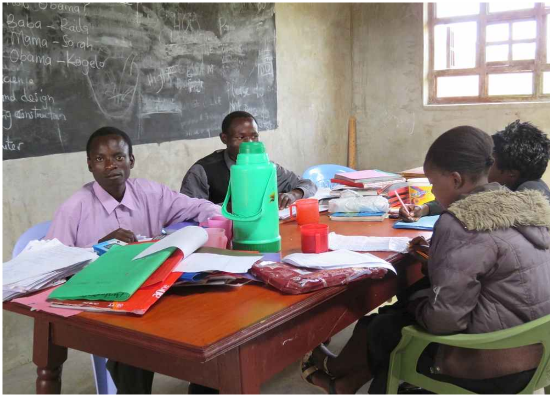
교무실에서 수업준비를 하고 있는 선생님들