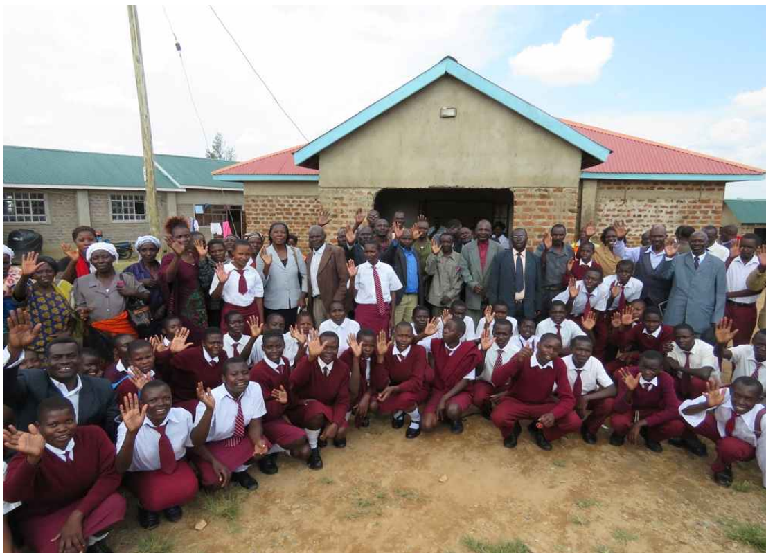
종강식을 마치고 학부형들과 학생들과 함께