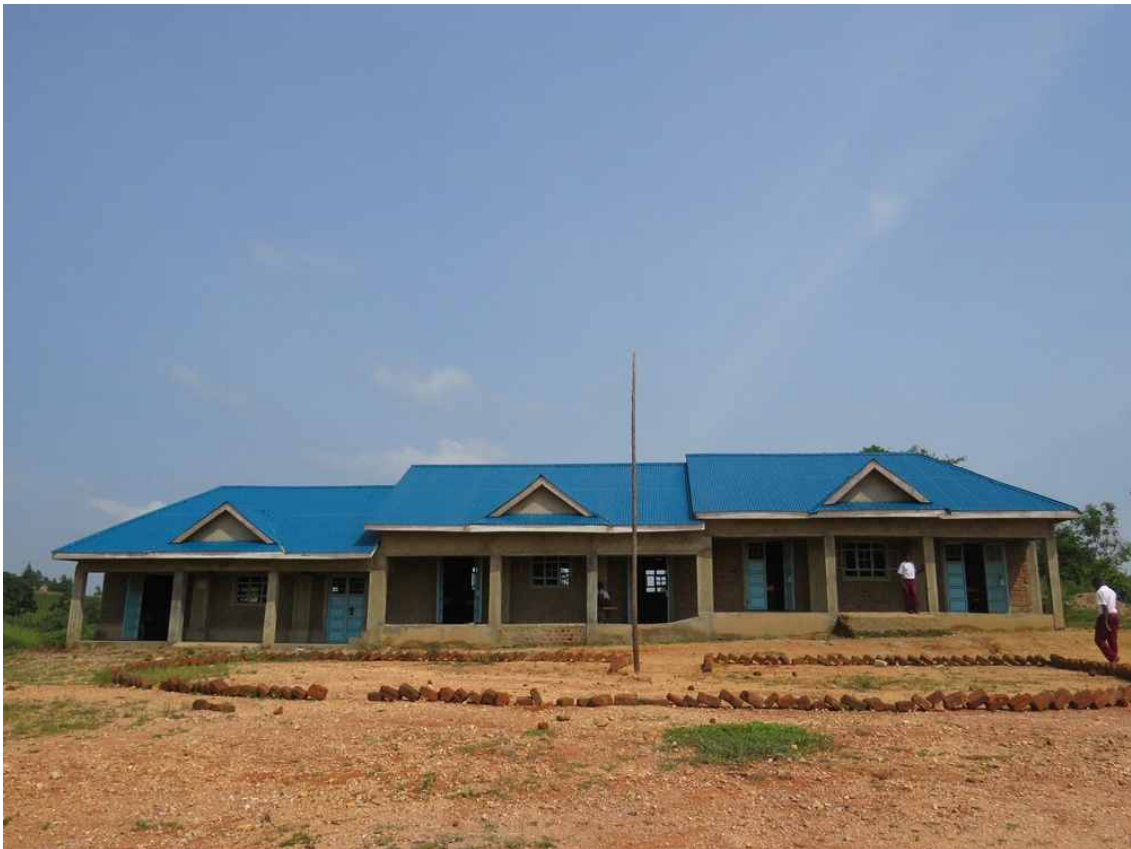
건축 된 교실 3칸 (2015.1)