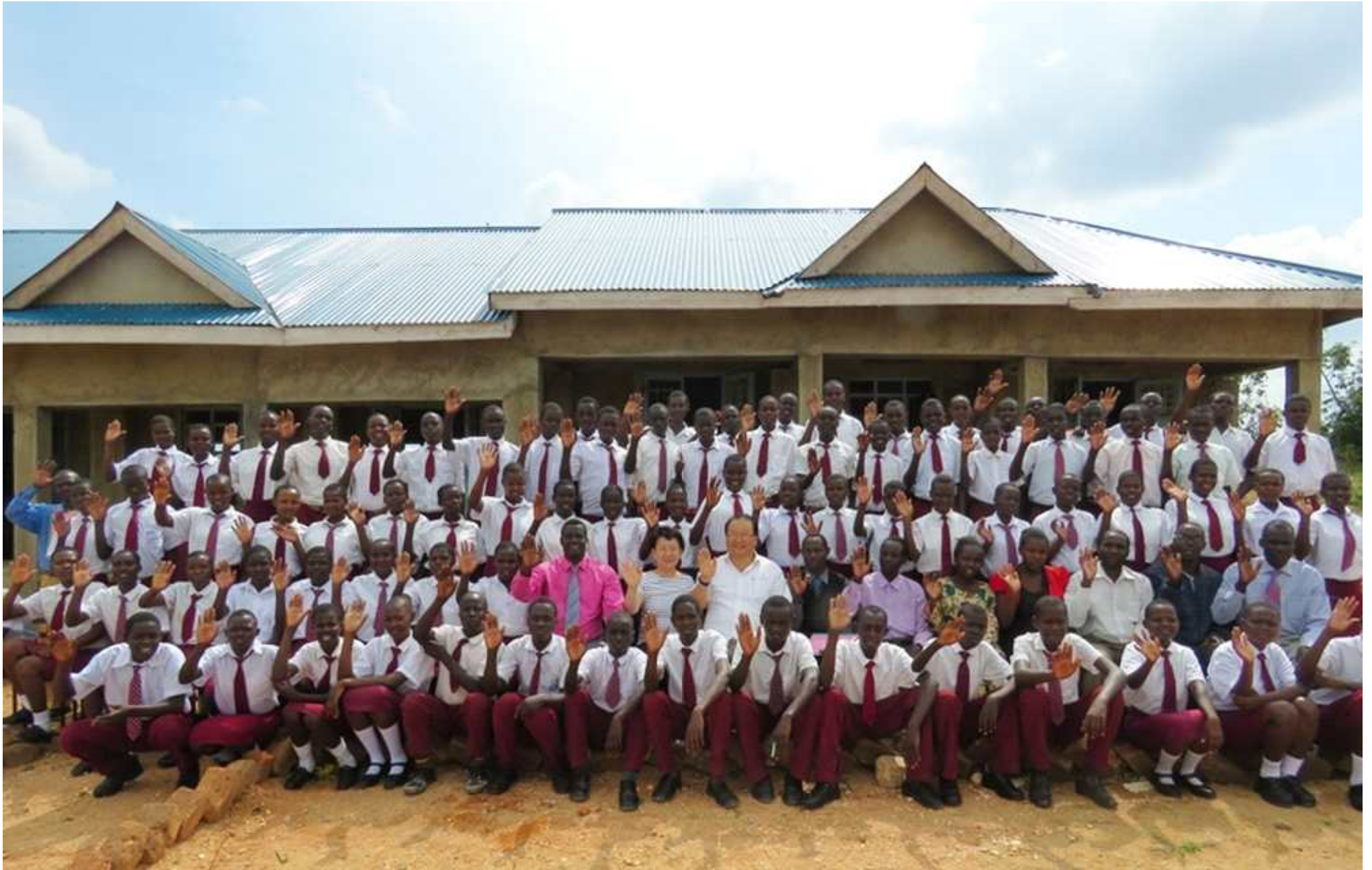
케냐 LWM 주을 중고등학교 선생님들과 학생들이 감사 인사드립니다! <2015년 기도와 재정으로 동역해 주셔서 감사드립니다!>