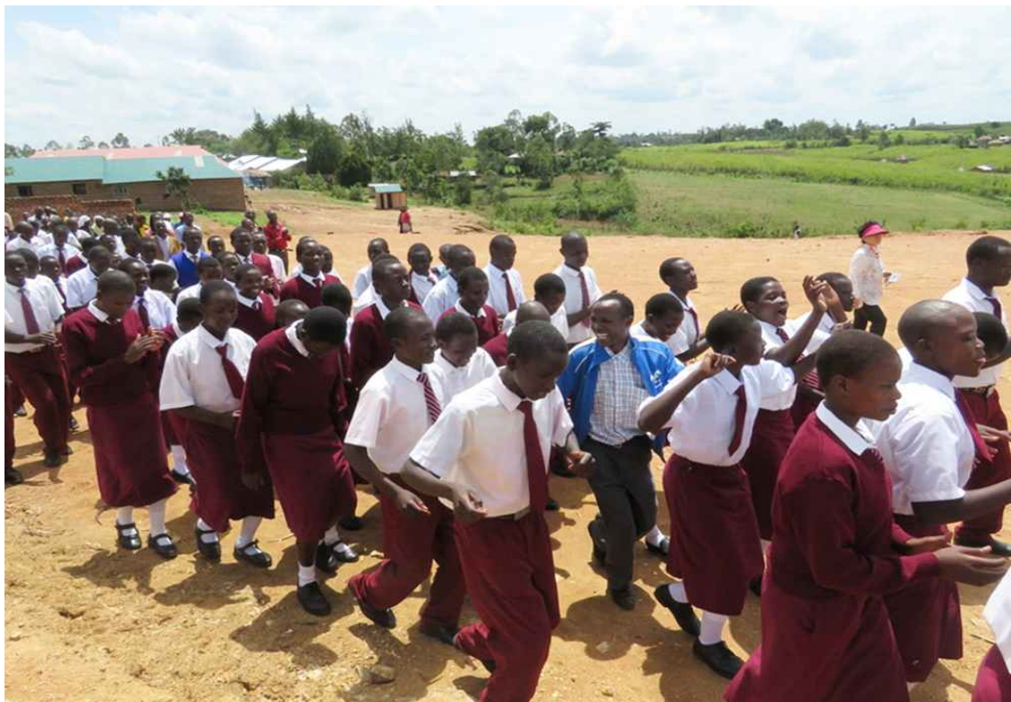
4월 첫 학기 종업식 후 운동장을 행진하는 학생들과 학부모