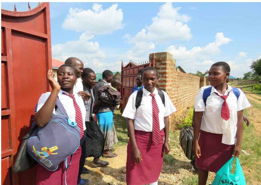
방학동안 고향으로 돌아가는 학생들