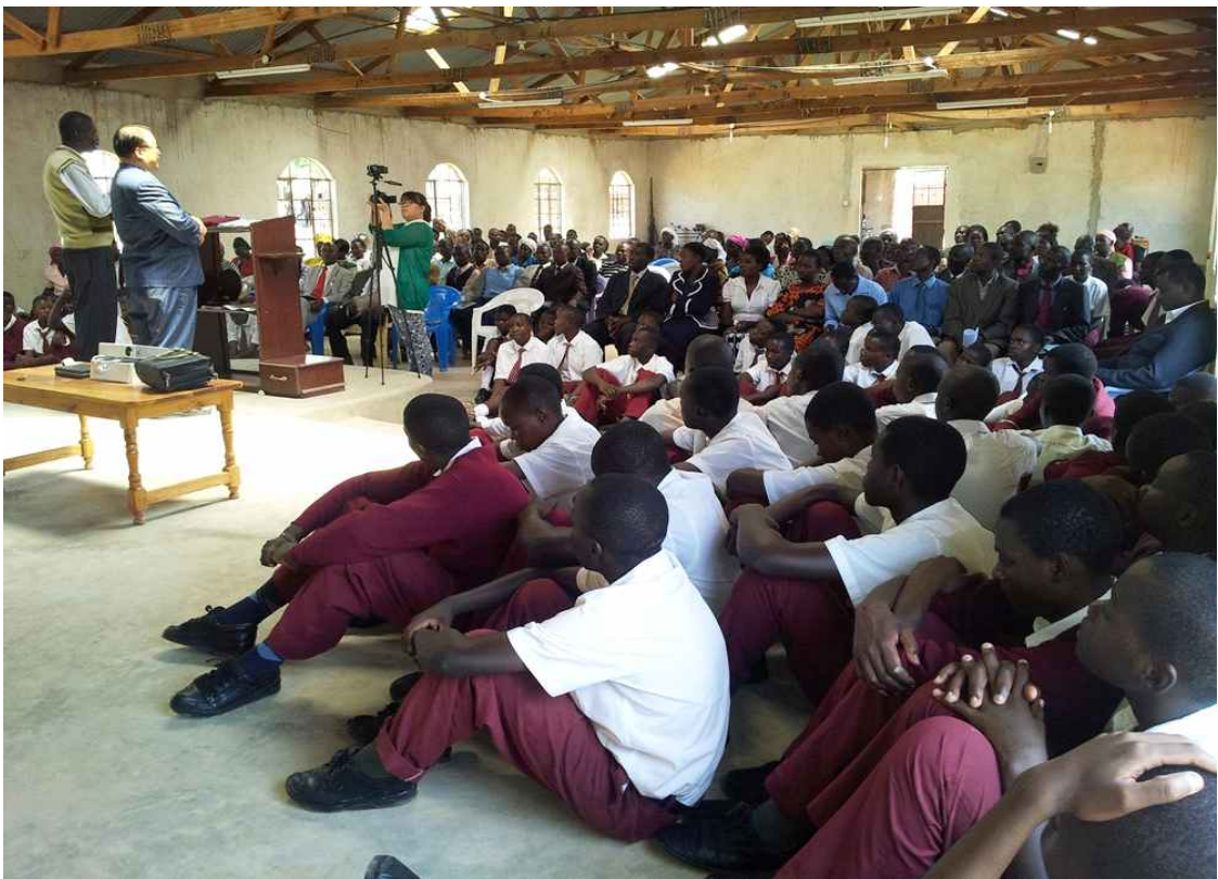
2학기 종강식 및 예배 (2015.7.)