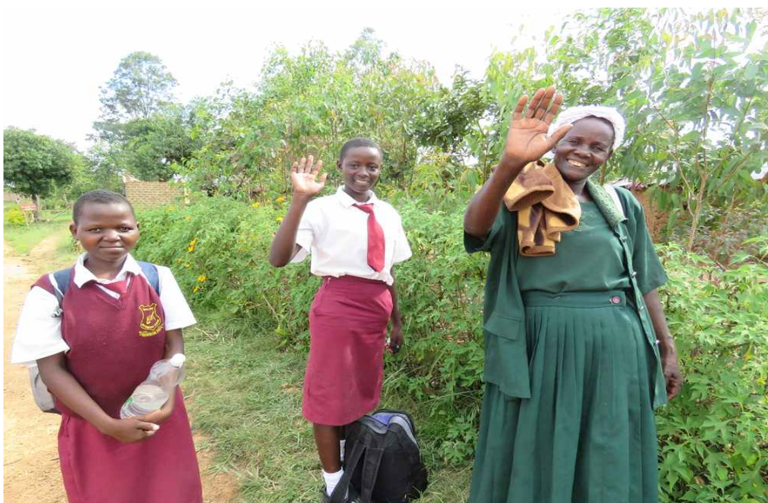
아쉬움을 남기며 감사 인사하는 학생과 학부형!