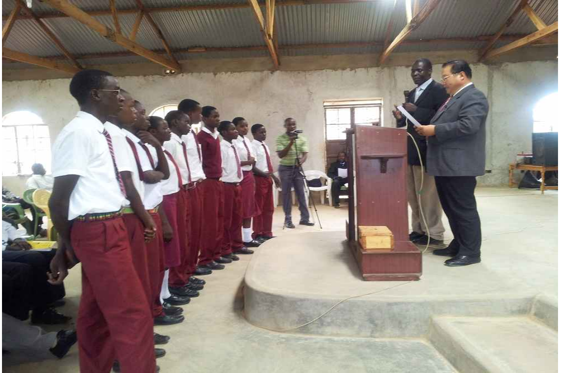
LWM 주을 장학금 수여(2015.4)