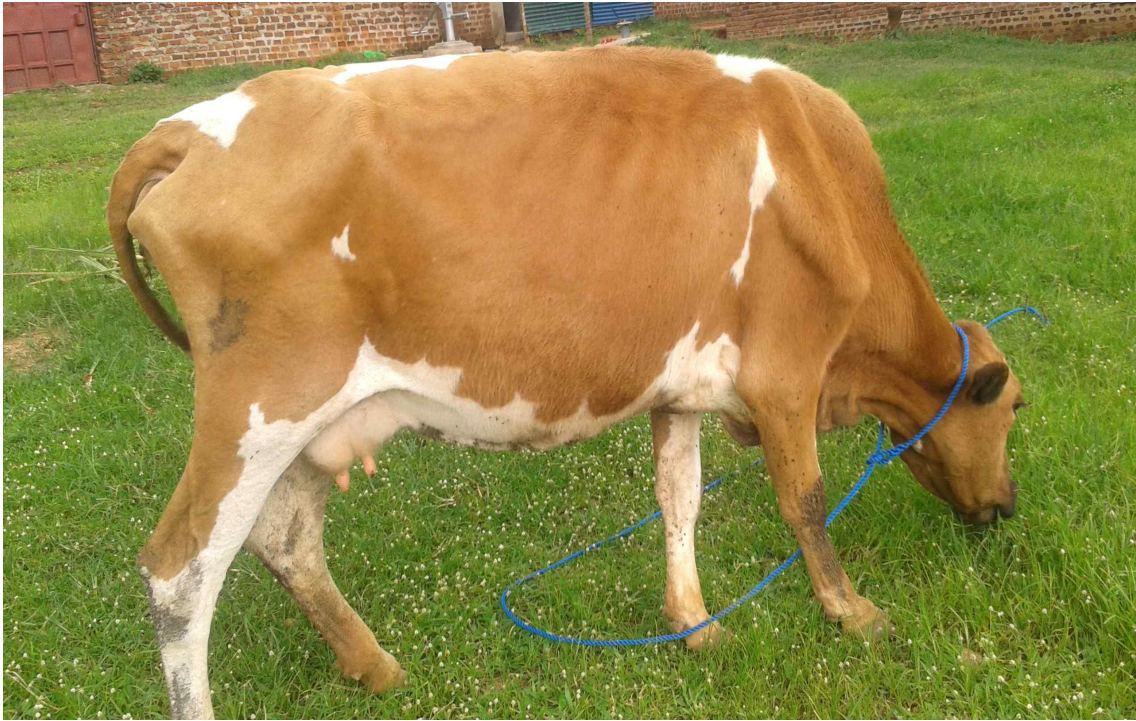
선생님들과 학생들에게 신선한 우유를 공급하고 있는 젖소