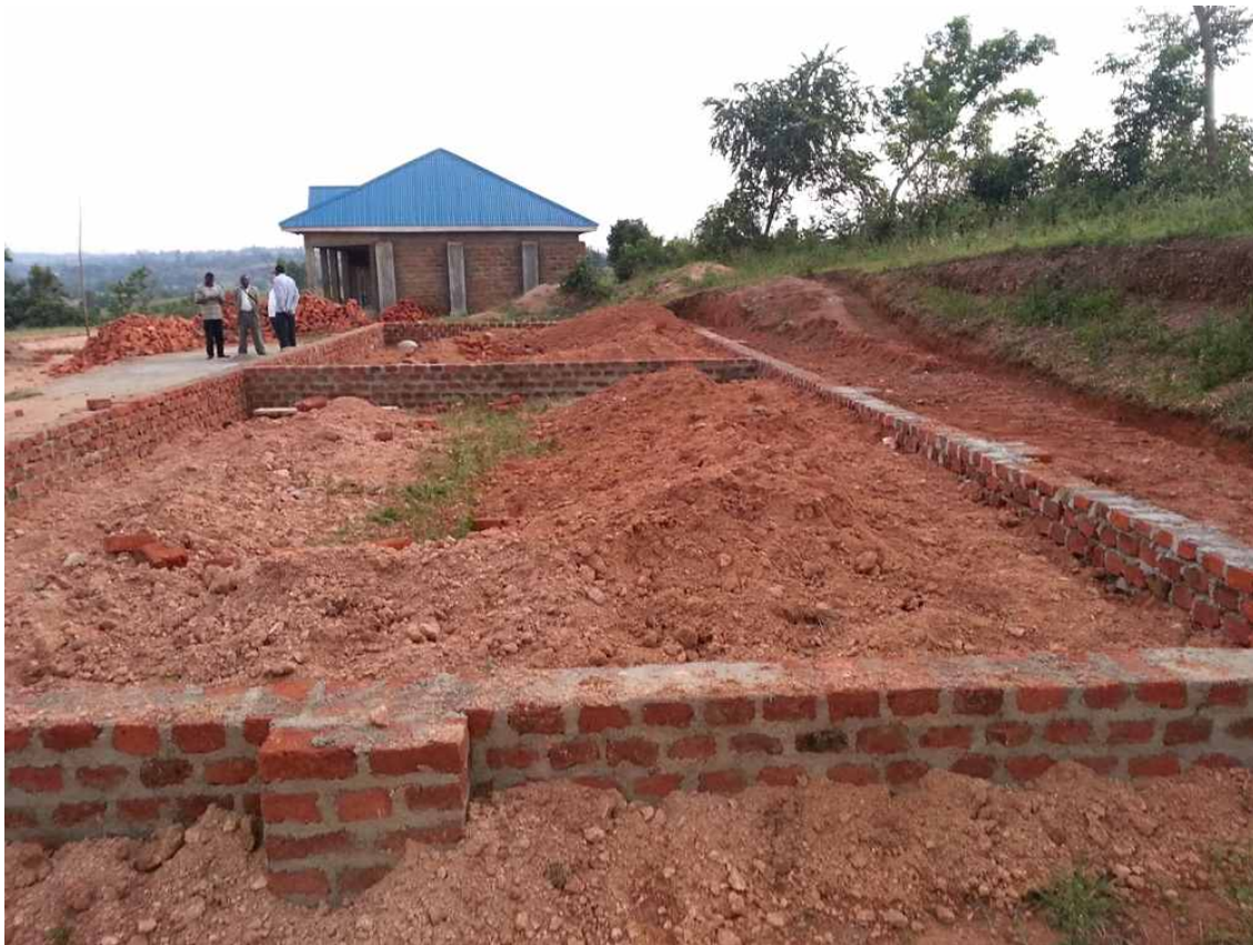
기초공사를 하고 있는 교실2칸 (2015.7.)