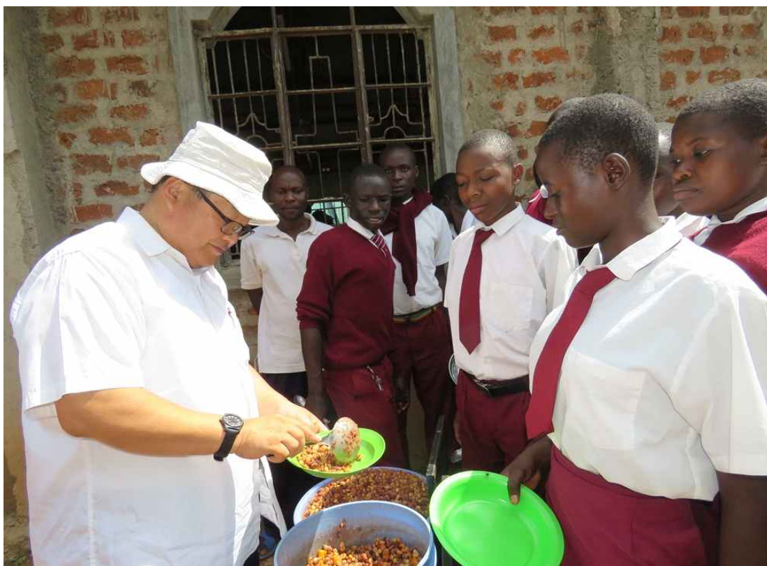
콩과 함께 하는 점심식사