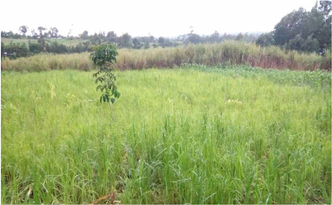
LWM 주을 중,고등학교 학생들의 식량조달을 위한 농지 구입 (2015.5)