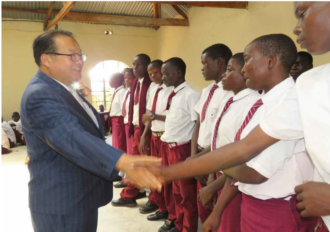
2학기를 종강하며 열심히 공부한 장학생들에게 장학금 전달